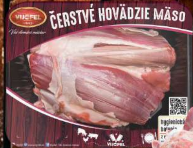
Hovädzia kľižka b.k.