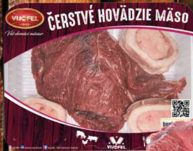
Hovädzie mäso polievkové s.k.