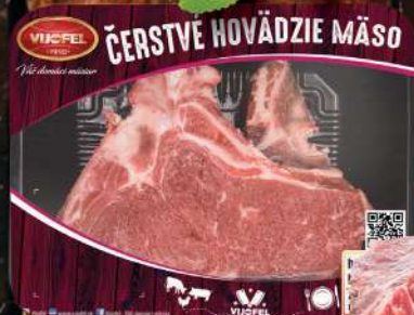
Hovädzí roštenec s.k.