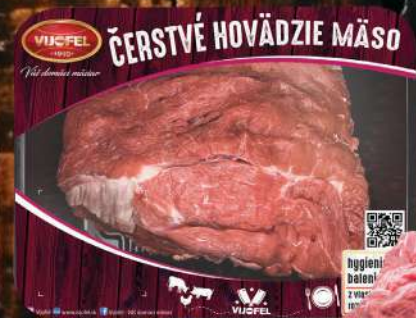
Hovädzie plece b.k.