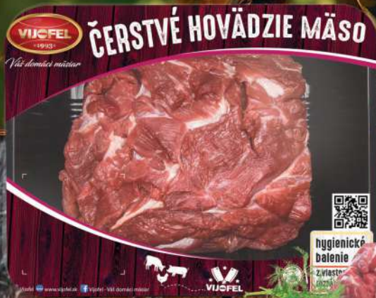
Hovädzí krk b.k.