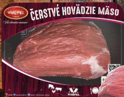
Hovädzie zadné b.k.