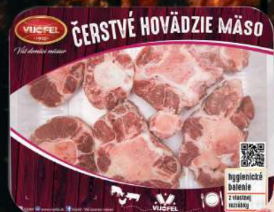
Hovädzí chvost rezaný